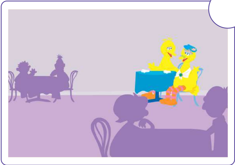
Se sientan a la mesa. Otras personas están comiendo y hablando a su alrededor.