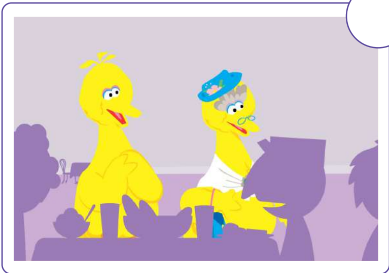
Big Bird y Abuelita entran al restaurante.