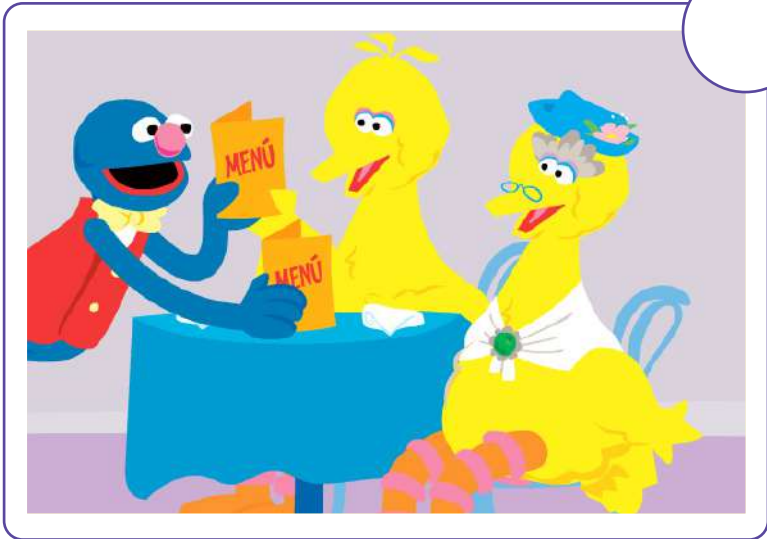
El mesero les trae el menú.